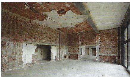
© R. MALLET-STEVENS, ADAGP | J.-L. PAILLÉ, CMN