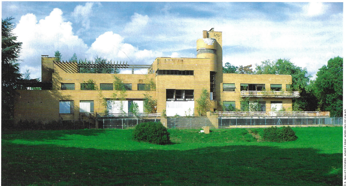
© R. MALLET-STEVENS, ADAGP | DRAC NORD-PAS-DE-CALAIS

de dood van Lucie Cavrois in 1987 raakte de villa danig in verval; de kostbare interieurmaterialen werden losgetrokken en opgestookt. In 1990 werd de villa echter geklasseerd als historisch monument dankzij de mobilisatie van burgers. In 2001 werd ze door de Franse Staat verworven en startte de DRAC Nord-Pas-de Calais (regionale vertegenwoordiging van het ministerie voor cultuur, nvdr) in 2003 met de restauratie die in 2008 door het Centre des Monuments Nationaux werd overgenomen. De villa werd dankzij bouwhistorisch