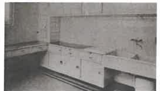
Boven: keuken, Bâtir 34 Onder: badkamer woning Speyer