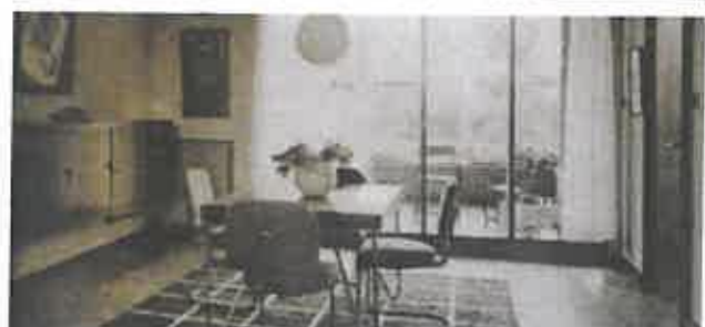
Boven: inkomhal woning Swart Onder: woonkamer woning Swart